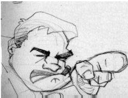
גם אני רוצה נביא כמו שיש לו

כתוב בפרשה פרק כ"ב פסוק ה', וישלח מלאכים אל בלעם בן בעור פתורה אשר על הנהר ארץ בני עמו וכו', המלך בלק שולח לקרוא לבלעם שיבוא לקלל את בני ישראל! כותב רש"י אם תשאל מפני מה השרה הקב"ה את שכניתו על עובד כוכבים רשע? למה בכלל הקב"ה נתן לבלעם כוחות כאלה שיש בידו לקלל ולברך כמו נביא שיש לו השראת שכונה? מסביר רש"י כדי שלא יהיה פתחון פה לעובדי כוכבים, שהם יכולים לומר אילו היו לנו נביאים כמו שיש ליהודים אז ודאי שהיינו חוזרים למוטב ונהיים צדיקים בדיוק כמו ישראל! מה עשה הקב"ה? באמת נתן להם נביא את בלעם, והם במקום להתעלות הם עשו להיפך, הם קלקלו, הם פרצו את כל הגדרים שהיו בעולם, שעד אותו הזמן הם היו גדורים בעריות, הם היו צנועים יותר, וכעת בא בלעם הרשע ונתן להם עצה להפקיר עצמם לזנות בכדי לקלל את עם ישראל!!