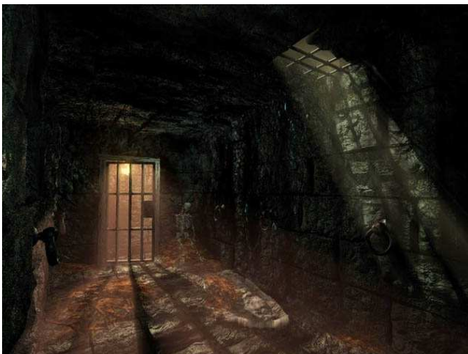
ונצא מאפלה לאורה במהרה

הגלות האחרונה משולה לחושך של תהום, בור תחתיות במחשכים במצולות! נזכה במהרה לדברי הנביא ישעיה: נחמו נחמו עמי!!