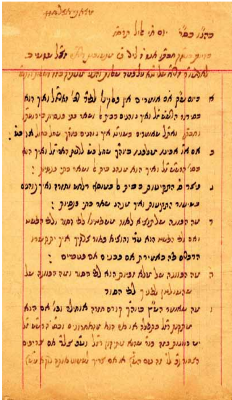
העתק שאלותיו של רבינו הרי"ח ותשובות מהר"א מני עליהם, בכת"י היע"ר: 'בהיותי בעה"ק חברון ת"ו, אינה ה' לידי כת"י מתשובות הרא"ם זצ"ל שהשיב לאדמו"ר הרי"ח שליט"א על כמה שאלות, והגני מעתיק בזה השאלות והתשובות...'

דעת לבנון כי פרסום כל חילופי השו"ת במתכונת רחבה זו, על ידי מי שאינו בעל מלאכה אחת, מלאכה גדולה היא, ועד אשר תושלם נמצאו הלומדים חסרים ח"ו. לזאת אמרנו כי טוב הדבר להניח לפני המעיינים ברכה, שאלות ותשובות אלו בעניני שבת, שלא ראו אור הדפוס עד הנה, בתוספת הערות נצרכות להשלמת הדברים בכתבי הגרי"ח. ועוד למועד חזון בהשלמת כל החיבור במתכונתו המלאה. תשלום שאר התשובות בעניני שבת נדפיס א"ה באחד הגיליונות הבאים.