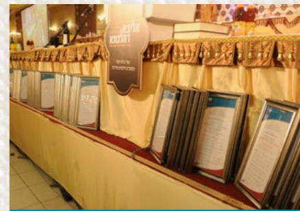
חלק ממאות תעודות כתר התורה שחולקו במעמד הסיום