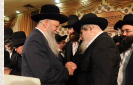
הגר"ד לנדו שליט"א בסוד שיה עם הרה"י הלל שליט"א