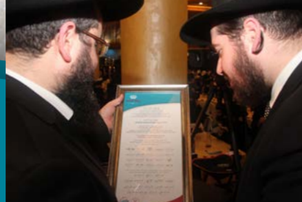
תעודת כתר התורה בחתימת גדולי הדור שליט"א