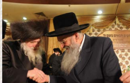
כ"ק האדמו"ר מטשערנבול בברכות לרה"י הגר"י הלל שליט"א