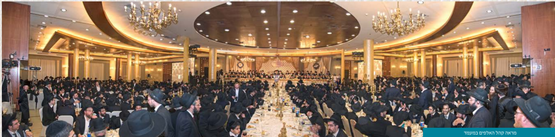
מראה קהל האלפים במעמד