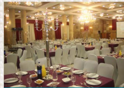
סעודת המצה לנשות האברכים