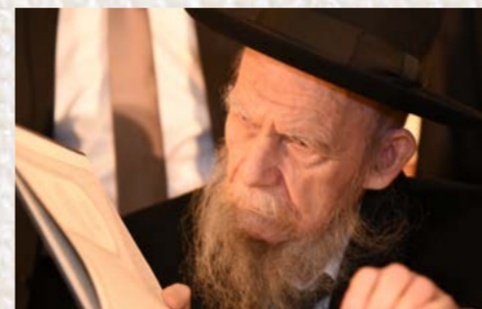
ראש ישיבת מניבד הגר"ג אולשטיין שליט"א