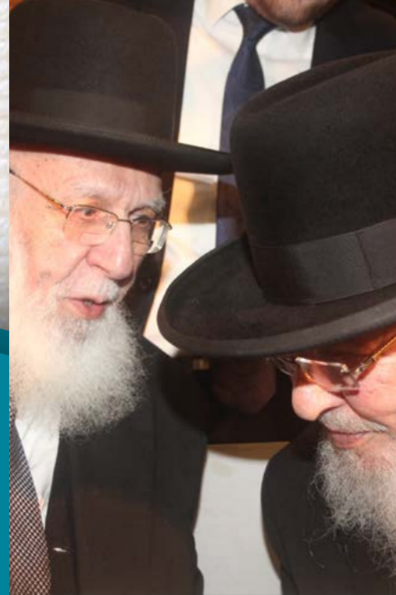
הגר"ש כהן שליט"א בסוד שיה עם הגר"מ אורחי שליט"א