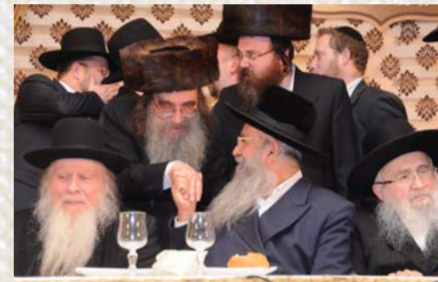
הגר"ד יפה, הרה"י הלל, הגר"ג קופשיץ והגרא"י פינקל שליט"א