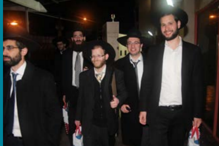
האברכים שליט"א ביציאתם מהמעמד והשי בידיהם