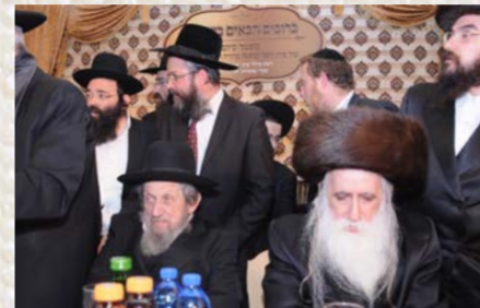
ראש ישיבת סלבודקא הגר"ד לנדו שליט"א עם כ"ק האדמו"ר ממכונקא בעלזא שליט"א