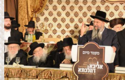
המשא המרכזי ע"י הרה"י הלל שליט"א, נראים, הגר"מ צ' ברגמן, הגר"ד יפה והגר"י שינר שליט"א