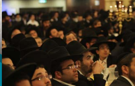
האברכים שליט"א במעמד