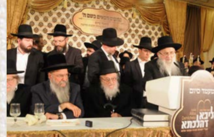
הגר"ד יפה שליט"א בברכה ברכה, נראים, הגר"מ צ' ברגמן, הרה"י הגר"י הלל והגר"י שינר שליט"א