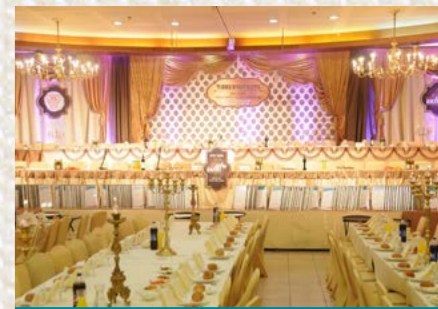
רקע בימת הכבוד