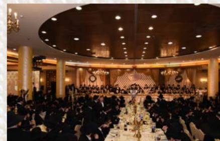
חלק מקהל האלפים בשמיעת המשא המרכזי ע"י ראש הישיבה הגר"י הלל שליט"א