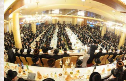
קהל האלפים בשמיעת המשא המרכזי ע"י הרה"י הלל שליט"א