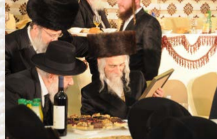
כ"ק האדמו"ר מסדינורא עם הגרא"י קוק שליט"א בעיון באתר התעודות