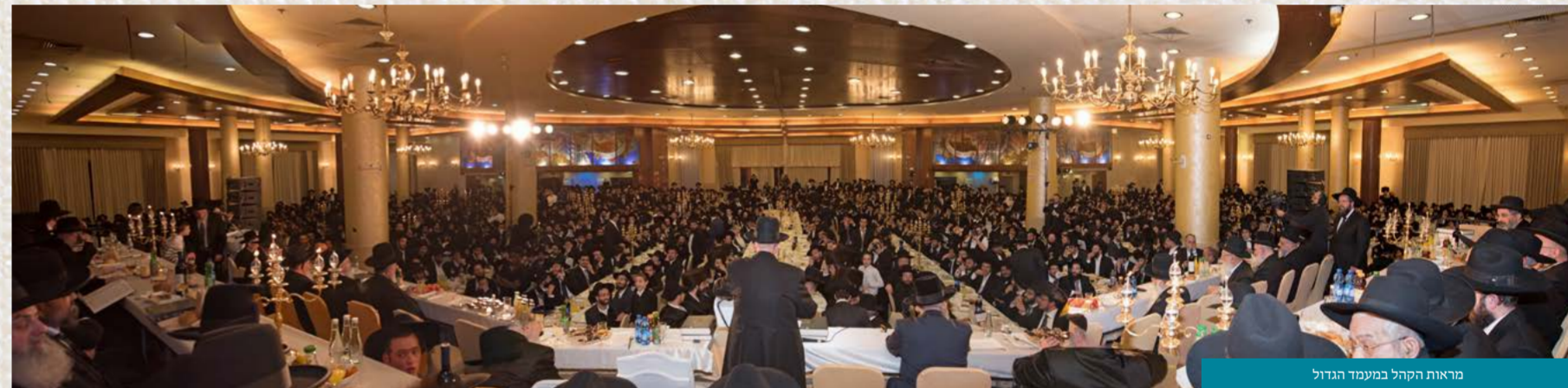
מראות הקהל במעמד הגדול