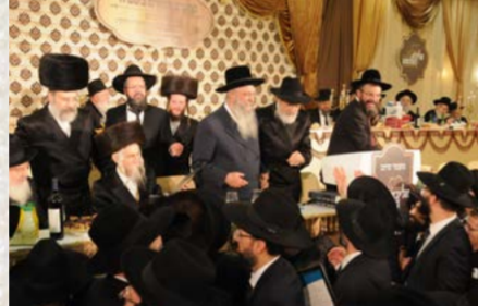
חלוקת תעודות וברכות ישי"כ לרה"י הגר"י הלל שליט"א, נראים עמו, כ"ק האדמו"ר מטשערנבול והגרא"י קוק שליט"א