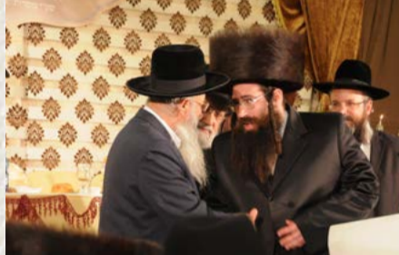
בן כ"ק האדמו"ר מציאנז שליט"א מוסר את ברכת אביו לרה"י הגר"י הלל שליט"א