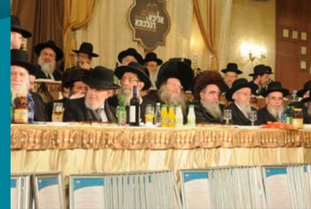
מראות גדולי התורה שליט"א בשולחן הכבוד