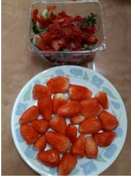
תות שדה לאחר קילוף השכבה החיצונית כולל הגומות

ערכנו בדיקות רבות באופנים שונים ועמל רב, ליעילות השטיפות להסרת חרקים בתות שדה - ונוכחנו כי השטיפות כפי מה שהיה מקובל אינן יעילות מספיק, ועלולים להישאר חרקים בודדים.