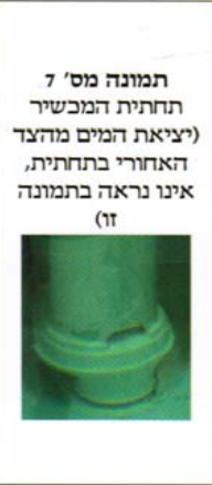
תמונה מס' 7 תחתית המכשיר (יציאת המים מהצד האחורי בתחתית, אינו נראה בתמונה זו)