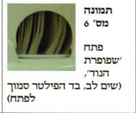
תמונה מס' 6 פתח 'שופרת הנוד', (שים לב, בד הפילטר סמוך לפתח)