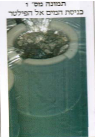
תמונה מס' 1 כניסת המים אל הפילטר