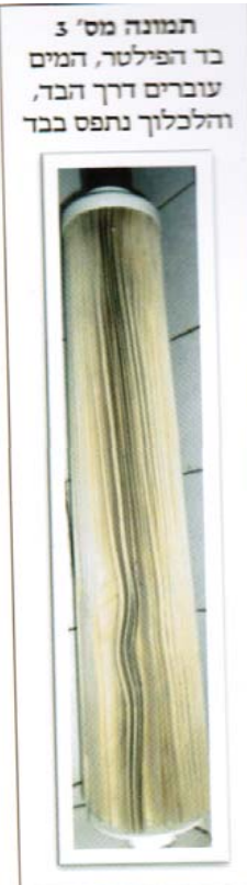
תמונה מס' 3 בד הפילטר, המים עוברים דרך הבד, והלכוך נתפס בבד