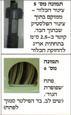
תמונה מס' 5 צינור הכלור - ממוקם בתוך צינור הפלסטיק שבתוך הבד, קוטר כ-2.5 ס"מ בתחתית אריג להחזקת הכלור