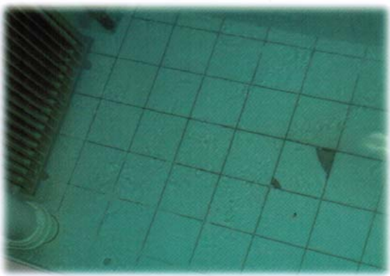
תמונה מס' 10 - תזוזת המים ניכרת על פני כל המקוה