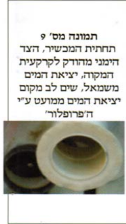
תמונה מס' 9 תחתית המכשיר, הצד הימני מזהודק לקרקעית המוקדה, יציאת המים משמאל, שים לב מקום יציאת המים ממועט ע"י ה'פרופלור'