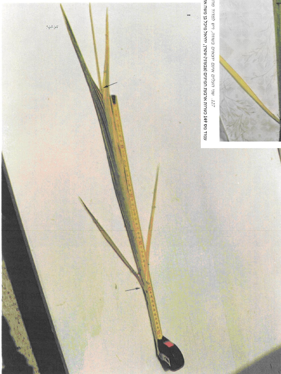
עמוד מס 149 כשרות ארבעת המינים (צבעוני) שטרן, יחיאל מיכל בן משה אהרן הודפס ע"י תכנת אוצר החכמה שגי תולעים אום יוצאים בשורה, ויש למדוד מהתלה העליון