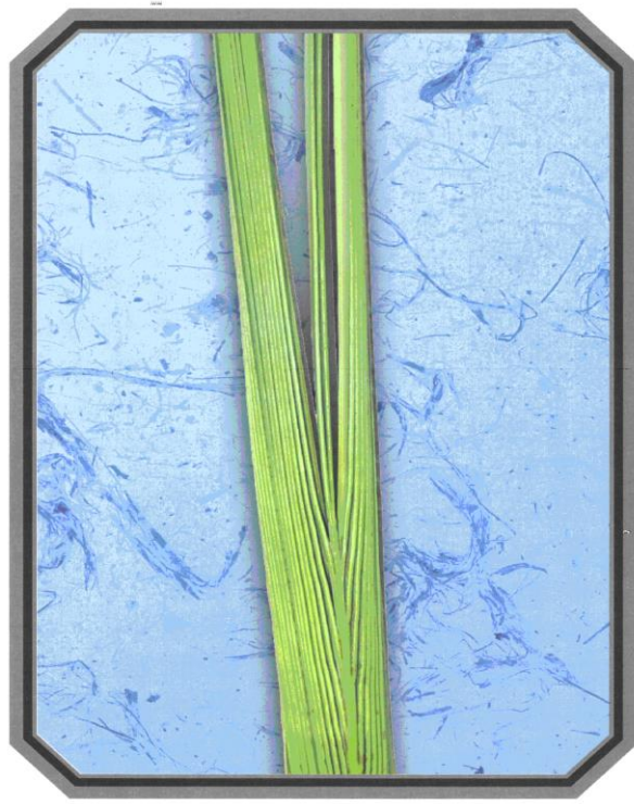
לולב המסתיים בשתי תיומות - שתי התיומות צריכות להיות מחוברות עמוד מס 77 ארבעת המינים למהדרין (צבעוני) עדס, אברהם חיים בן דניאל הודפס ע"י תכנת אוצר החכמה