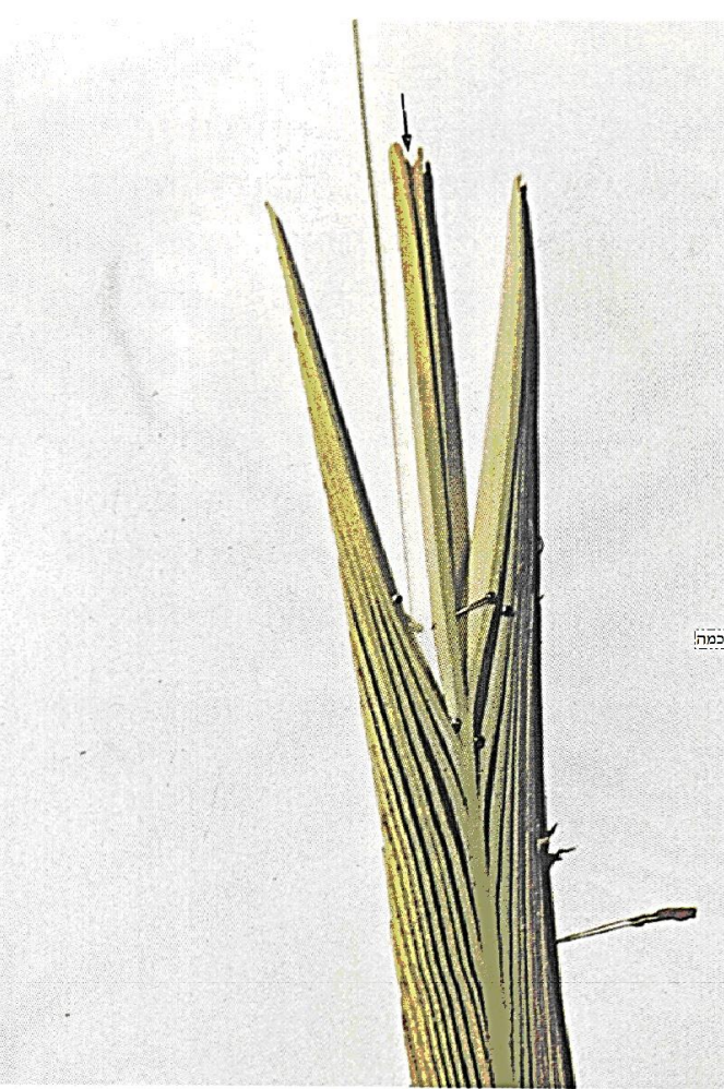
.. נחלקה התיומת, עלה האמצעי הכפול, נחלק