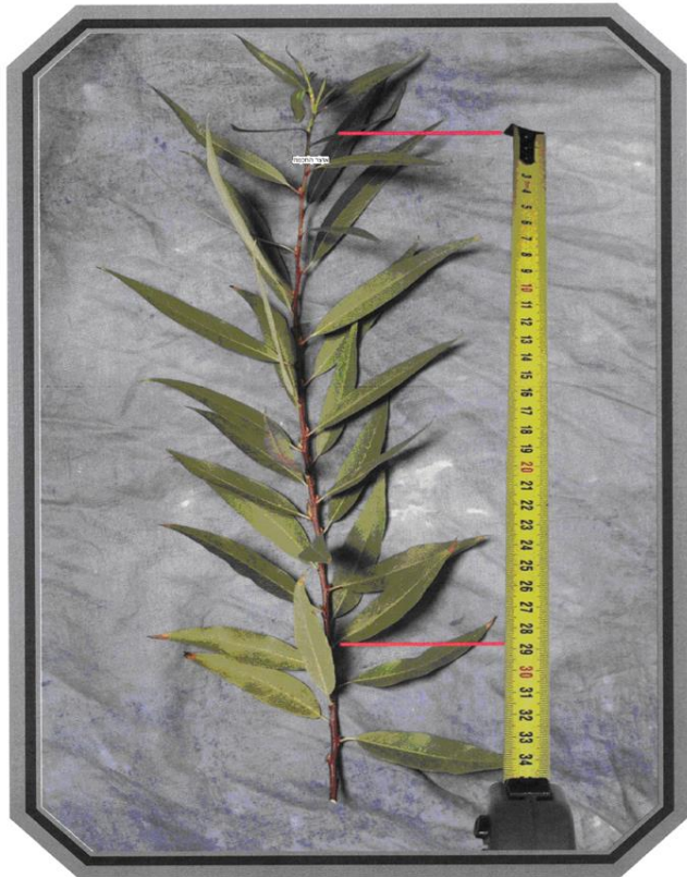
שיעור הערבה ג' טפחים

עמוד מס 245 ארבעת המינים למהדרין (צבעוני) עדס, אברהם חיים בן דניאל הודפס ע"י תכנת אוצר החכמה